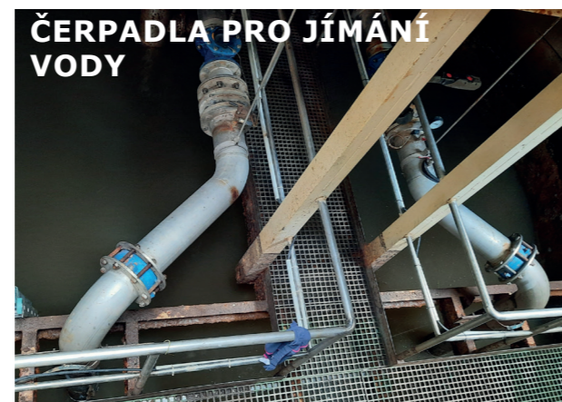
ČERPADLA PRO JÍMÁNÍ VODY